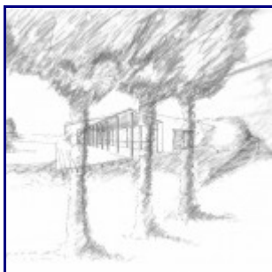
Dibuix pavelló semisoterrat que no s'ha realitzat